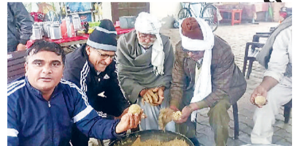
टोहाना। मकर संक्रांति पर गायरों को खिलाने के लिए तिल व गुड़ के लड्डू बनाते गौसेवक।

कड़ाके की सर्दी के चलते जहां अनाज कम है बाहर निकालने की चेष्टा नहीं करता और अपने घर में ही दुबक कर बैठा है, वही गोवंशों के लिए भी यह सर्दी बड़ी ही खतरनाक होती है। ऐसे में उन्हें गर्माहट देने के लिए गुड़, तिल जैसे पोषक तत्वों की आवश्यकता होती है। नंदीशाला में लोहड़ी व मकर संक्रांति के पर्व पर गौवंशों के लिए बाजरे, तिल व गुड़ आदि, गुड़, तिल, अजवाइन व सौंफ आदि अच्छी तरह मिलाकर व भूनकर इन्हें तैयार किया गया है।