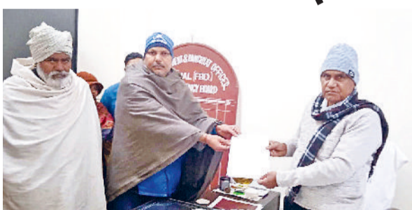
जाखल। अधिकारियों को ज्ञापन देते साधनवास गांव के लोग।