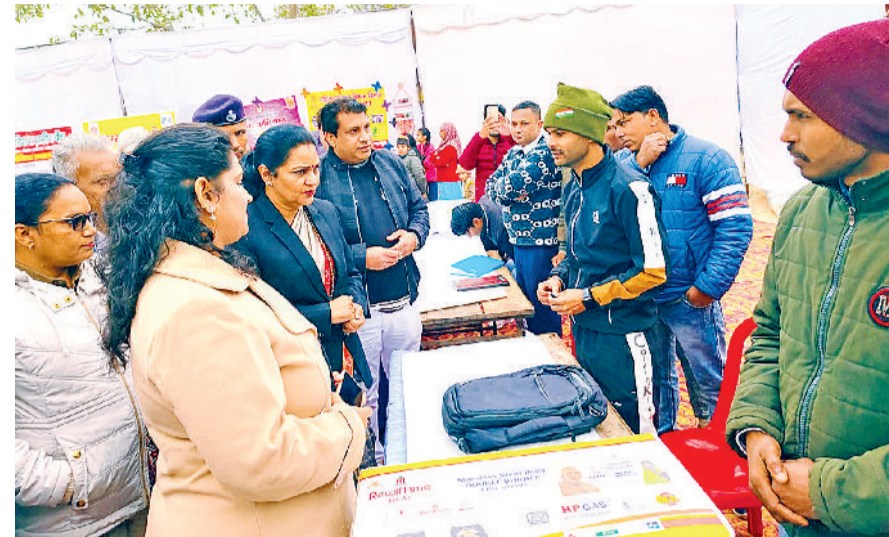
सिरसा। जनसंवाद कार्यक्रम में ग्रामीणों की शिकायतें सुनीती सांसद सुनीता दुग्गल।