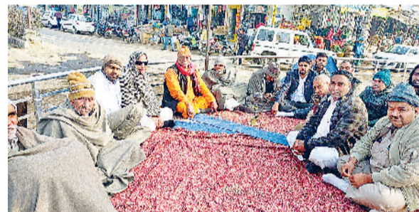
सिरसा। पानी निकासी की मांग को लेकर धरना देते लोग।