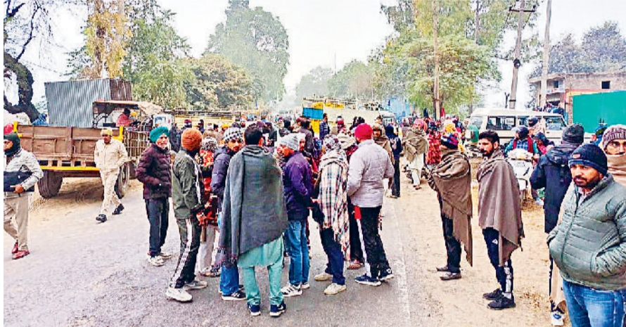
रतिया। आरोपी चालक की गिरफ्तारी की मांग को लेकर रोड जाम करते ग्रामवासी।