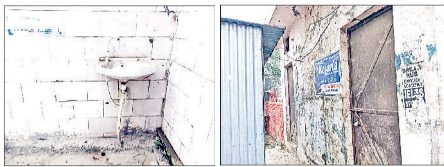
जाखल। शौचालयों में लगे ताले व फैली गंदगी।

नई ग्राम पंचायतों का गठन हुए सालभर से अधिक समय बीत चुका है। नवनिर्वाचित इन ग्राम पंचायतों में हालांकि बजट के हिसाब से विकास कार्य भी किए जा रहे हैं लेकिन घनी आबादी वाले गांव कुलां और धारसूल स्वच्छता के अभाव में पिछड़ते नजर आ रहे हैं। तत्कालीन ग्राम पंचायतों द्वारा यहां जनसुविधा के लिए लाखों रुपए खर्च कर बनवाए गए सार्वजनिक शौचालय देखरेख के अभाव में खंडहर हो गए हैं। स्थिति ये है कि स्वच्छ भारत मिशन के तहत घोषित की गई ओडीएफ पंचायतों में रहने वाले लोग आज भी मजबूरन खुले में शौच जा रहे हैं। देखरेख के अभाव में शौचालय खंडहर बने और गंदगी से लबालब भरे हुए हैं। प्रशासन की लापरवाही से कुलां में जाखल रोड पर यात्री प्रतीक्षालय पर बने शौचालयों में ताले लगे हुए हैं।