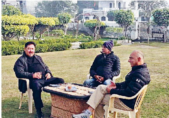
फतेहाबाद। पार्क में बैठकर धूप का आनंद लेते लोग।

फतेहाबाद में 15 दिन बाद बुधवार को धूप निकली तो पिछले कई दिनों से भीषण ठंड का सामना कर रहे लोगों के चेहरे भी खिल उठे। कंकपताती ठंड में अब तक घरों में दुबके लोगों ने घरों से बाहर निकल कर पार्कों में धूप का मजा लिया। इससे पूर्व यहां 5 दिनों से बादल छाए हुए थे। सूर्य देवता के दर्शन तक